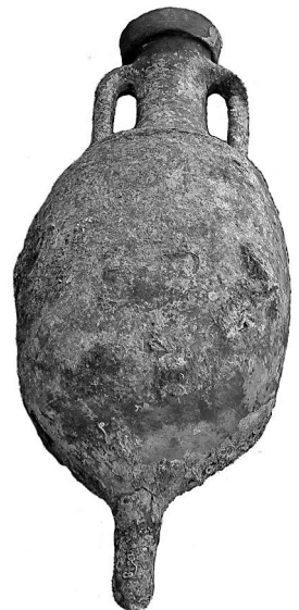
Afb. 1 - De intacte amfoor met afmetingen van 95x38cm

Het onderzoek werd volgens het boekje uitgevoerd, beginnend met het in kaart brengen van de huidige situatie van de site. Hierbij werd een meetgrid over de site (10x20m) aangelegd. Nu kon het gebied systematisch verkend worden. Tijdens die verkenningen werden reeds interessante vondsten gedaan, waaronder een intacte amfoor (Afb. 1), een amfoorkraag met stempel (Afb. 2: AROHELA, een Romeins handelaar) en twee zwaar gecorrodeerde loden platen.