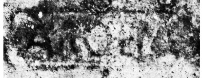
Afb. 2 - Stempel in de rand van de amfoor: AROHELA

Na de verkenningen werd een sleuf van 1x3 m gekozen en met behulp van een onderwaterstofzuiger van sediment ontdaan. Hierbij werden tien resten van amforen gevonden (Afb. 3) die nog (voor een geoefend oog) in een gestapeld verband lagen.