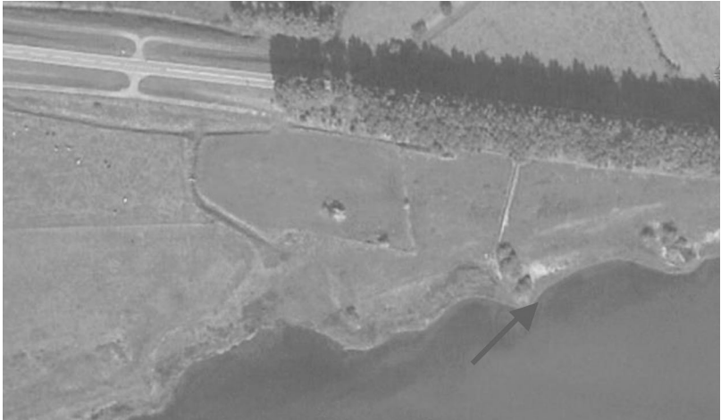
Afb. 1 - Locatie van het wrak in "het gat van Alem".

Hoewel botters en schokkers nog geen eeuw geleden de meest gebruikte vissersschepen van de Zuiderzee waren, zijn nog slechts weinig intacte exemplaren bekend. Mogelijk is het wrak bij Alem een welkome ontdekking.