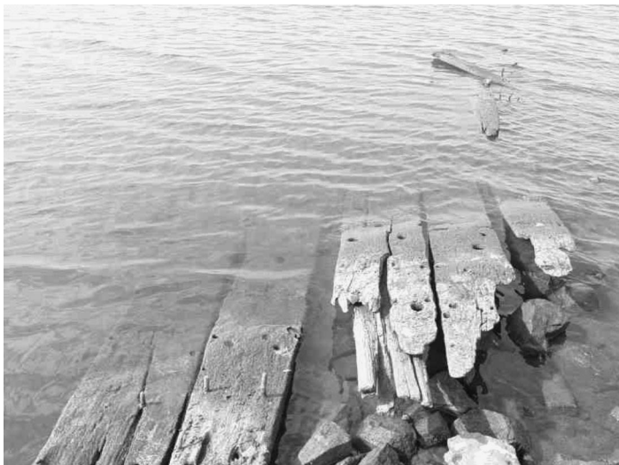
Afb. 2 - Scheepswand- of dek-planken.