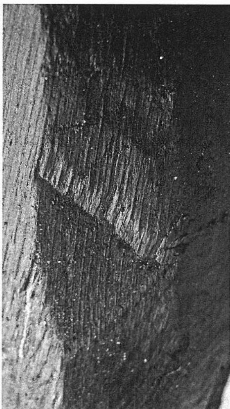
Afb. 3. Kapsporen op de punt van de paal.

R.M. van Aalst, Verslag verkenning Wijchens meer 2001-2004, Mergor in Mosam, 2004.