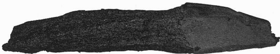
Afb. 2. Aangepunte houten paal.