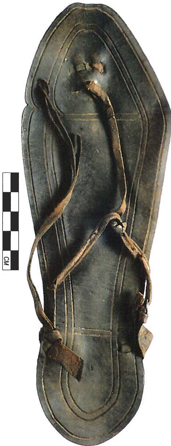
Afb. 3 Sandaal (foto: A. Dekker, AAC).

Een eigenaardig soort schoeisel dat vrij plotseling aan het einde van de 3e eeuw opkomt, is uit één stuk leer gesneden en kunstig aan elkaar genaaid (afb. 5-7). Het bovenleer is zeer laag om de voet uitgesneden, waardoor een aparte oplossing gezocht moest worden voor de sluiting. Dankzij de goede conservering kon in enkele gevallen het eigenaardige verloop van de sluitingsveter precies gevolgd worden. Beginnend bij de enkel loopt de veter via twee spleetjes aan weerskanten van de schoen onder de voet door en dan terug naar een lus aan de tegenoverlig-