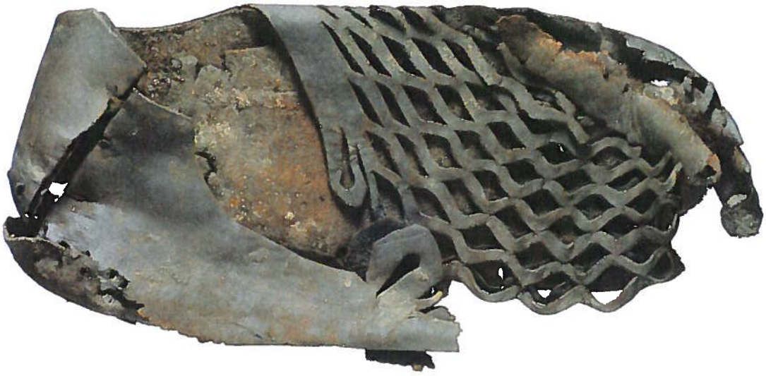
Afb. 10 Expanderende ruitjesschoen (foto: A. Dekker, AAC).

mee aan de internationale mode, zoals afgebeeld in het graf te Silistra en op de kleurrijke mozaïeken in het mogelijk keizerlijke paleis Piazza Amerina op Sicilië. In het straatbeeld van Cuijk rond 340 na Chr. zien wij mannen met veterschoenen en lange, gekleurde sokken of voethozen, waarover een tunica, versierd met ingeweven sierelementen, en een mantel, vastgespeld met een grote drieknopsfibula. 13 Zware, met metaal bezette riemen completeren het kostuum. Bij de vrouwen zijn slechts de versierde teentjes van hun slippers zichtbaar onder de lange, eveneens versierde tunica's en gedrapeerde mantels. Armbanden zijn in deze tijd weer in de mode, en het opgestoken haar is bedekt door haarnetten of hoofddoeken die bevestigd zijn met grote, glimmende spelden. Van de metalen onderdelen zijn in Cuijk al enkele exemplaren gevonden; nu komen de schoenen erbij en zo wordt het beeld steeds completer. 14