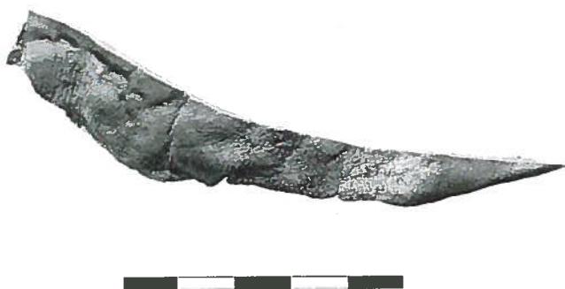
Afb. 2 Afsnijdsel met tang- indrukken.

4e eeuw is uitermate zeldzaam, en iedere nieuwe vondst vormt een wezenlijke vermeerdering van onze kennis over deze duistere periode. De internationale belangstelling loog er ook niet om: zowel National Geographic (Benelux), het Jaarboek van de Encyclopedia Britannica en het Amerikaanse blad Archaeology besteedden allemaal aandacht aan “stylish Roman shoes dating from the 4th century AD found by Dutch amateur underwater archaeologists in the Meuse River near Amsterdam”. 6