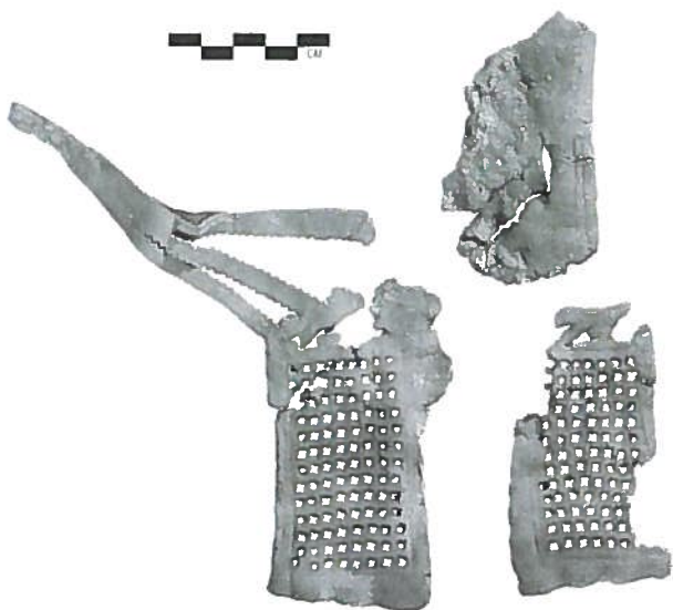
Afb. 7 Versierd exemplaar.

moeten wij juist naar het noorden kijken, buiten het Romeinse Rijk. In het veen Damendorf bij Schleswig (D) is naast het lijk van een man een paar schoenen gevonden dat bijna identiek is aan die uit Cuijk. 9 Verschillende technische details geven echter aan dat deze lokaal vervaardigd werden, evenals een wat boerse nabootsing gevonden in een waterput in de nederzetting Wijster (Drenthe). 10 Het ziet er naar uit dat Romeinse schoenmakers in Ceuclum speciale schoenen vervaardigden voor Germaanse soldaten die