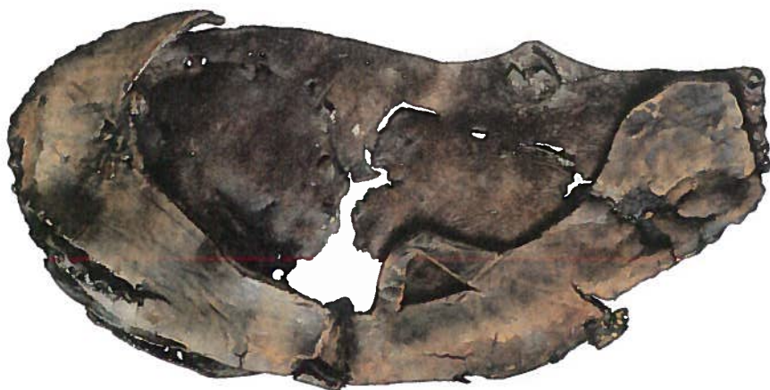
Afb. 6 Vetschoen met aparte veter.

Terwijl de vorige schoensoorten sterke mediterrane invloeden vertegenwoordigen, komt ruim een derde van de schoenen voort uit een heel andere traditie. Deze zijn ook uit een enkel stuk leer gemaakt, maar met slechts een hielnaad om vorm te geven. Verder zijn kleine insnijdingen in het leer aangebracht, zodat het als een soort net over de voet getrokken kan worden (afb. 10, reconstructie afb. 1 rechtsboven). In tegenstelling tot de nauwsluitende, diep uitgesneden schoenen die al besproken zijn, zijn dit ruimzittende, makkelijk verstelbare modellen. Pas bij het maken van een replica voor het Museum Ceuclum bleek hoe moeilijk het is deze insnijdingen te maken, want het leer moet niet al te rekbaar zijn en het patroon moet ook nog netjes en sierlijk om de voet sluiten. Deze schoenen zijn ook door professionele schoenmakers ter plekke gemaakt en vormen in Cuijk een van de meest populaire modellen. Maar op andere Romeinse vindplaatsen is deze vorm onbekend. Voor de - zeldzame - vergelijkingsstukken