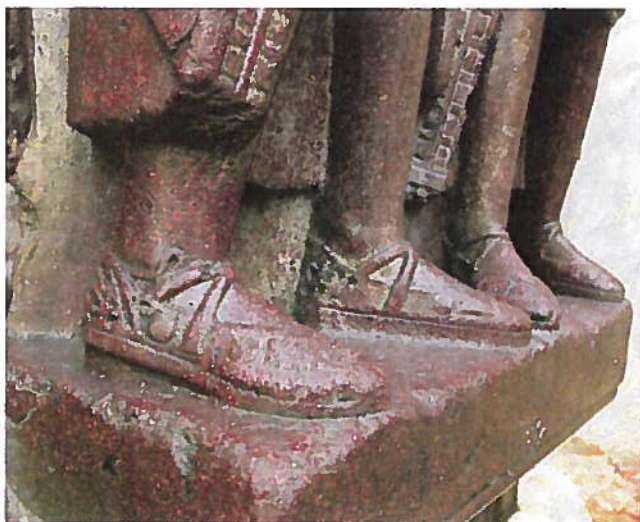
Afb. 8 Het beeld van de Tetrarchen in Venetië.

in het Romeinse leger dienst deden. Als dat zo is, dan is opvallend dat deze Germanen hun families meebrachten, want deze schoenen komen in alle maten voor, van klein tot supergroot.