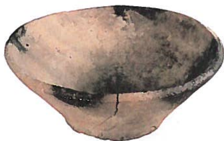
Afb. 4 Romeins kroesje met zwarte rand; schaal- verdeling in cm (Foto Laurens Mul- kens).

Het feit dat de mate van vergrauwing en verglazing heel beperkt is gebleven, zou kunnen betekenen dat het kroesje al kort na productie voor het oorspronkelijke doel onbruikbaar geworden was. De flinke scheur in de wand is hier mogelijk de oorzaak van.