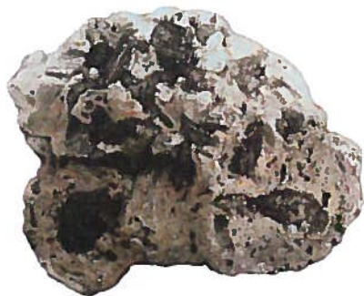
Afb. 5 Romeinse ijzerslak met houtskoolin- sluitsels; schaalver- deling in cm.

lijk een gevolg van zuurstofarm stoken en niet het gevolg van de aanwezigheid van loodverbindingen. Het zwarte verglaasde materiaal werd eerst met behulp van EDX en later met FT-IRS spectroscopy geanalyseerd en bleek te bestaan uit een koolstofverbinding van organische oorsprong met lange alifatische ketens. Hiervoor komen onder andere teerachtige substanties in aanmerking, maar zeker geen loodsilicaat. Kortom, er werden op het kroesje geen sporen van een cupelleerproces gevonden en dus is het zeer waarschijnlijk nooit gebruikt voor cupellieren. Het is zelfs maar de vraag of het daarvoor ooit bedoeld was, gezien de fragiliteit en de zorg waarmee het werd vervaardigd. Cupels zijn vaak dikwandig, grof en onafgewerkt 21 , typische wegwerp-producten. Intrigerend zijn in ieder geval wel de restanten van het teerachtige materiaal. Uit het feit dat ze precies midden op de grijze vlekken zitten, mag geconcludeerd worden dat het teerachtig materiaal in een oven voor de plaatselijk reducerende atmosfeer heeft gezorgd, waardoor het onderliggende keramiek grijs verkleurde. Welke organische stof door de hitte van de oven in het teerachtig materiaal omgezet werd en wat men daarmee wilde bereiken, is nog niet bekend. Het kroesje heeft haar geheimen nog niet prijsgegeven. Heeft iemand een suggestie?