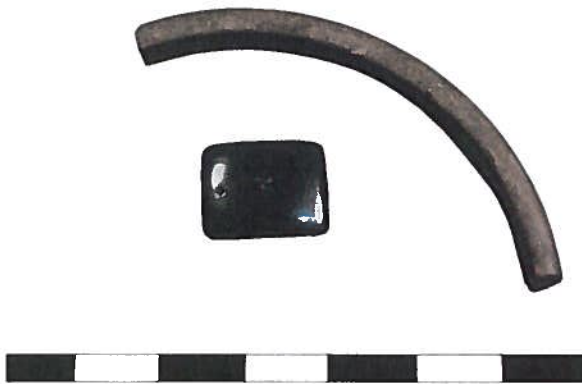
Afb. 2 Romeins armband- fragment en Ro- meins kraal van git; schaalverdeling in cm (Foto Laurens Mulkens).

Git is een diepzwart mineraal, dat deel uitmaakt van de familie der gefossiliseerde plantenresten, waartoe ook steenkool en aardolie behoren. De leden van deze familie zijn honderden miljoenen jaren geleden ontstaan, toen grote hoeveelheden plantenresten onder grote druk begraven raakten onder dikke pakketten sediment van zand en klei. Wat precies gevormd werd, hing af van de soort plantenresten en de omstandigheden waaronder ze begraven werden 6 . Sommige leden van deze familie zijn voldoende stevig en lenen zich voor bewerking tot sieraden en gebruiksvoorwerpen. Het hoofdbestanddeel zijn koolstofverbindingen waar vaak wat sediment (silicaat) door gemengd is. De soort koolstofverbindingen is, evenals het aandeel sediment, karakteristiek voor het lid van de familie. Infrarood spectroscopie (FT-IRS) geeft de mogelijkheid om (niet-destructief) de soorten verbindingen aan te tonen en dus de verschillende materiaaltypes te onderscheiden 7 . Van de vier materialen 8 die al in de oudheid tot sieraden verwerkt werden (git, ligniet, olieschalie en cannel-coal), is git naast ligniet omwille van haar diepzwarte kleur, de meest gewilde. Beide bestaan uit gefossiliseerde houtresten. Olieschalie is gevormd uit kleinere plantenresten, waar-tussen zich meer sediment heeft kunnen vermengen. De kleur is dus ook niet echt diepzwart.