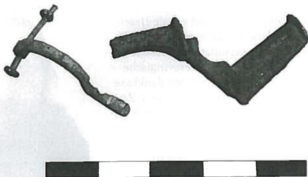
Afb. 1 Romeinse fibulae- fragmenten met groen (links) en zwart (rechts) pati- na; schaalverdeling in cm (Foto Laurens Mulken).